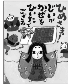
ひめさま! じいがかぜをひいたでござる 丸山誠司/作 光村教育出版

じいは どうしたのじゃ。 まだ かげが なおらんのか。 はよー じいに あいたいぞよ。