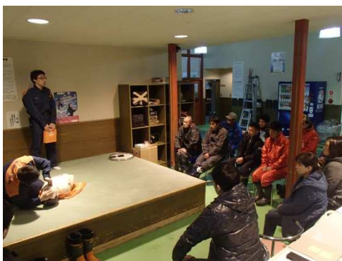
シーズン前の救急救命講習会