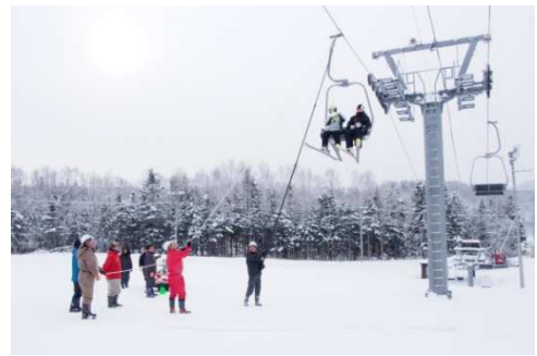
シーズン前の救助訓練状況