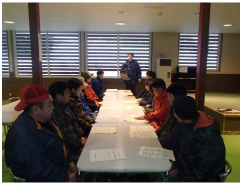
シーズン前の安全教育講習会