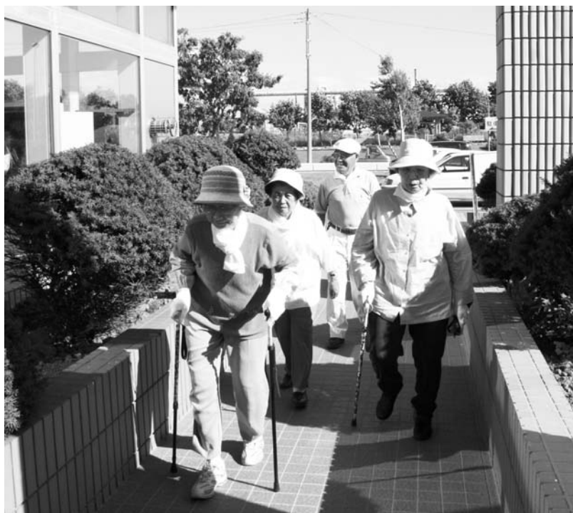
訓練参加者のみなさんは、徒歩や車で中央公民館まで避難しました。ご近所のお年寄りに声をかけ車に乗せて参加したという方もいました。