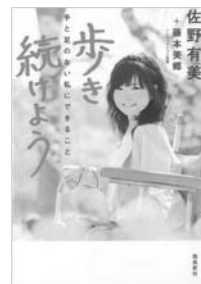
歩き続けよう手と足のない私にできること 佐野 有美 藤本 美郷 著 / 飛鳥新社

4月1日に生まれた双子の姉妹、「よしえ」と「ときえ」。 嘘をついてばかりの人生だけだあの事だけは絶対に知られてはいけない……。奇才の女芸人が紡ぐ小説。