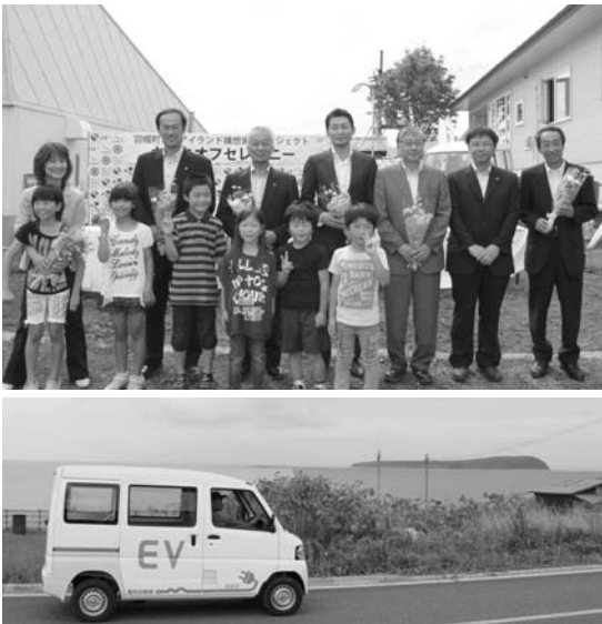
プロジェクトの関係5者が協定締結した9月10日のセレモニーには、島の子どもたちも記念に参加。島を走る電気自動車。海の向こうは焼尻島。

※小型風力発電機の設置期間中、発電機の様子と天売港の様子をインターネットに掲載しています。羽幌町ホームページからご覧いただけます。