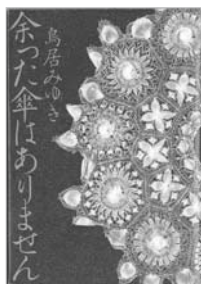
余った傘はありません 鳥居 みゆき 著 / 幻冬舎

4月1日に生まれた双子の姉妹、「よしえ」と「ときえ」。 嘘をついてばかりの人生だけだあの事だけは絶対に知られてはいけない……。奇才の女芸人が紡ぐ小説。