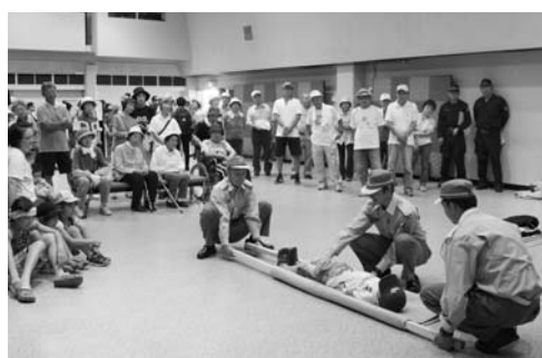
災害に対応する初期活動訓練では、木材と毛布を使い負傷者を搬送する方法を学びました。