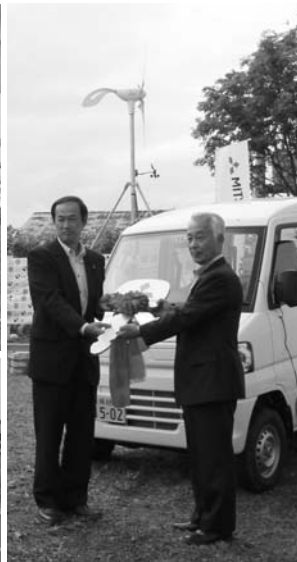
電気自動車のゴールデンキーが北海道三菱自動車販売より舟橋町長に。