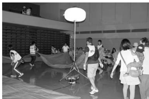
次々と避難者が集まる中、役場職員は、発電機から照明を照らしシートを敷き避難所の設置訓練。

災害が発生した場合、まず自分の身を自分で守ることが大切です。また、地域のみなさんが助け合うことも重要となります。災害による被害を最小限にするため、この機会に家族や職場、地域で話し合い、防災に対する意識を高めましょう。