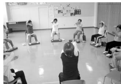
この春から活動をスタートした自主グループ「転ばん塾」。

昨年度までは、地域包括支援センターの事業として転倒予防教室「転ばん塾」を実施していましたが、修了後も健康づくりに関心の