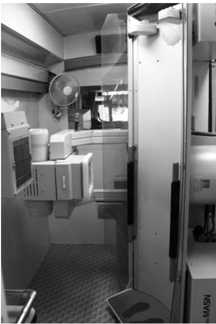
▶巡回検診車の内部。検査は、バリウムと発泡剤を飲んで検診台に乗り、向きを変えながらレントゲン撮影するのが一般的です。

■年に1回、胃がん検診を 町でも7月と1月の年2回、胃がん検診を実施しています。年に一度は胃がん検診を受けましょう。