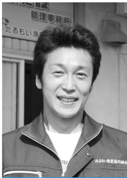
北るもい漁協 冷蔵加工課経理係長