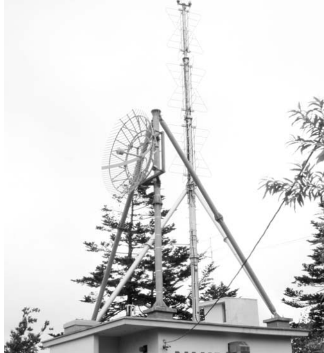
Ⓢ 地上デジタル放送を開始するため準備を進めている羽幌中継局。現在のアナログからデジタルへの切替工事が8月下旬にスタートします。

羽幌中継局で地デジを放送しますが、本放送を前に試験電波を放射して機器の調整などを行います。試験電波の発射は、平成21年11月下旬を予定。本放送開始はNHKが12月中、HTB・UHB・STV・HBC・TVhの民放5社は12月下旬の予定となっています。これにより、町内のほとんどの地区で地デジを受信できますが、曙地区など一部の地区は、共聴施設工事終了後(春以降)となる見込みです。