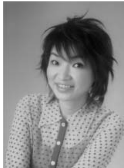
テレビでもおなじみの 清水ミチコがやってくる!!