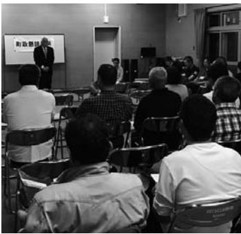
お問い合わせ 地域振興課広報広聴係 ☎ 68-7013 (課直通)

8月27日・28日、両島の研修センターで町政懇談会を開催しました。27日、焼尻地区では20名、28日、天売地区では17名のみなさんが参加され、島の暮らしに関わるご意見、ご要望等を伺うことができました。みなさんとの意見交換の一部(要旨)をご紹介します。