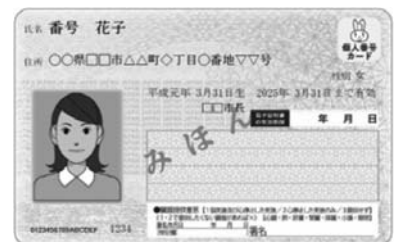
※マイナンバーカード