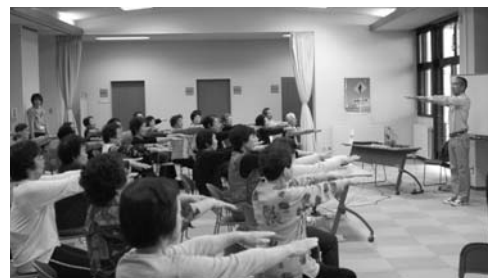
介護予防教室の様子