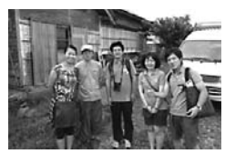
歩きテクチャーの目玉・明治時代後期に建てられた鯨番屋を見学しました！

キテクチャー（建築をあわせて私が考えた造語でわかりやすく言えば、歩いて散策しながら建物を見てまわろうといった趣旨です。集客と滞在時間を増やし、天売島のことをもっと深く知ってもらおうのが狙いです。今回は、鯨番屋天売高校海龍寺、厳島神社などを3時間程で見まわりました。また、建物見学だけでなく島の自然や歴史についても初めの実施であったため、受付方法やコース設定など改善しなければいけない点多々ありましたが、来年も実施したいと思います。天売島は周囲わずか約12