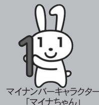
マイナンバーキャラクター 「マイナちゃん」

マイナンバー（個人番号）の導入に たり、事業者のみなさまは平成28年1月以降、 や社会保障の手 きで、 業員などのマイナンバーを記載することになるため、 業員の方々からマイナンバーを取得し、適切に管理 保管する必要があります。