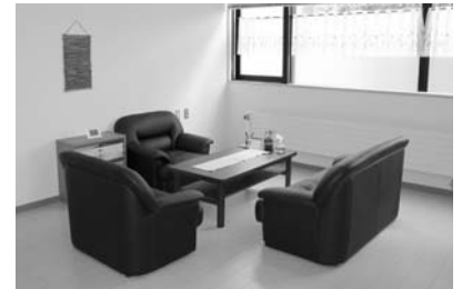
大きな窓から日が差した部屋で、ソファに座り、リラックスして相談ができます。

カウンセリングは基本的には対話で行います。また、箱庭療法・絵画療法・遊戯療法など言葉に頼らない方法もあります。