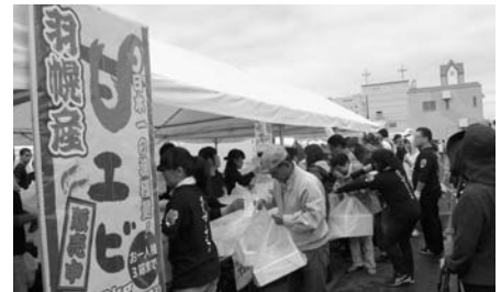
※甘エビの販売は当日「整理券」を配布します。

漁獲量日本一の甘エビが主役の、年に1度の一大イベント。今年の甘エビは、なんと去年の2倍の10トン! まつりに使われる甘エビは、エビかご漁船がこの2日間だけのためにフル操業して漁獲し、鮮度抜群の状態で会場へ搬入されます。当日会場では、ひとり2箱(1箱2キロ入り)限定の浜値で提供します。また、昨年好評だった希少特大甘エビを今年も数量限定で販売します。