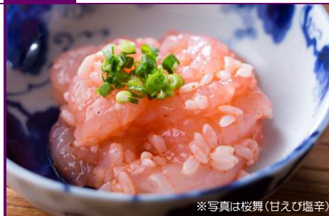
※写真は桜舞(甘えび塩辛)

【内容】鮭トバ(430g)×1袋 桜舞(甘えび塩辛80g)×2本 賞味期限3ヶ月以内 [配送]冷凍